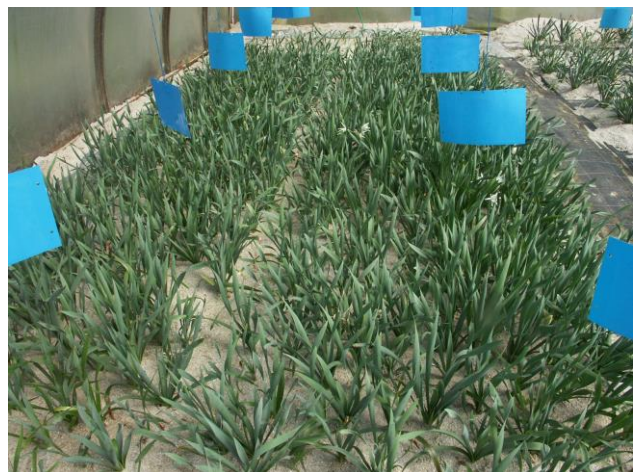
Nos cultures de Lys de Mer en serre