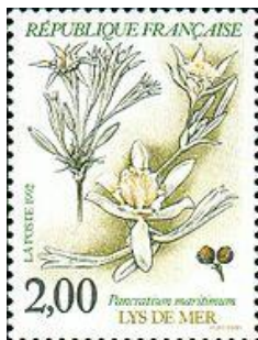
Timbre français représentant le Lys de Mer - 1992

Un timbre représentant le « Lys de Mer » a été émis en 1992 par la poste française, à plus de 5 millions d'exemplaires. Il fait partie d'une série « Nature de France - Plantes des marais » totalisant 4 espèces remarquables (Orchis palustris, Drosera rotundifolia et Nuphar lutea).