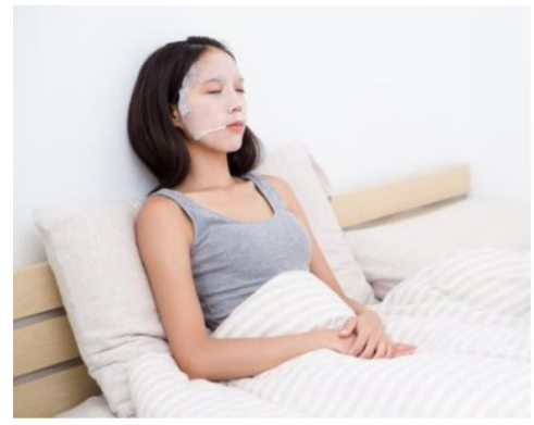
Mintel estime que le marché chinois des masques de beauté devrait poursuivre sa croissance en valeur à un rythme annuel moyen de 15,8% au cours des cinq prochaines années, pour atteindre 31,746 millions de RMB d'ici 2021.

Les consommatrices chinoises ne semblent pas se lasser des masques pour le visage. Si l'on en croit une récente étude de Mintel, le marché des masques de beauté en Chine progresse à un rythme impressionnant, avec un taux de croissance annuel moyen de 29% en valeur au cours de la période 2011-2016.